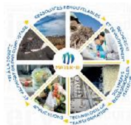
Le cycle de vie du Mater-Bi

Les matériaux compostables et biodégradables sont spécifiquement conçus pour faciliter le retour au sol des matières organiques, sous forme de compost de haute qualité, car ils permettent d'optimiser la collecte séparée des biodéchets, en évitant la contamination par le plastique. Les bioproduits, tels que les biolubrifiants, les ingrédients biodégradables pour les cosmétiques et les bioherbicides biodégradables, sont également conçus pour protéger le sol et les ressources en eau de la pollution, avec le même objectif final de contribuer à l'obtention d'une matière organique de qualité. En développant ce modèle, Novamont collabore avec différents partenaires - institutions, organismes de recherche, agriculteurs, collectivités locales et composteurs - afin de créer des partenariats et des alliances stratégiques axés sur la définition de normes de haute qualité, sur leur application et leur contrôle. L'objectif principal est de contribuer, à travers des études de cas, à approfondir le potentiel de la bioéconomie tournée vers la régénération territoriale et la sauvegarde des sols.