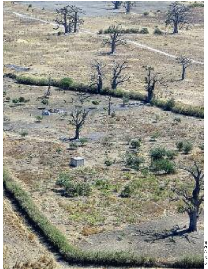
J. Bouyer @ Cirad