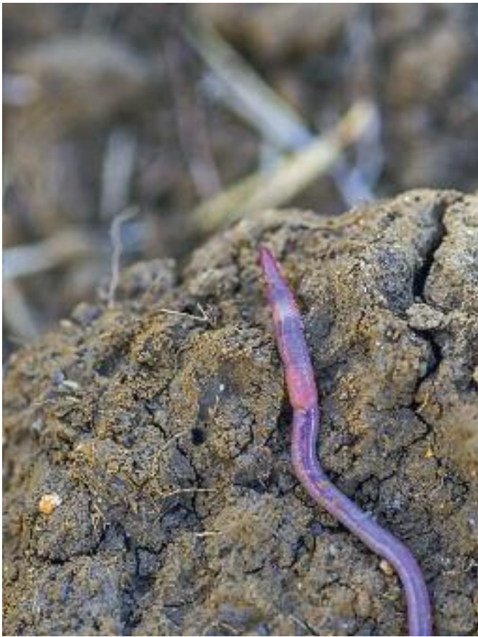
Cherick Sansou @ iMIL_Agrif